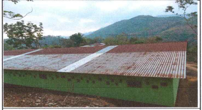
Foto 4: Se observa el deterioro de las laminas portantes del modulo 2.