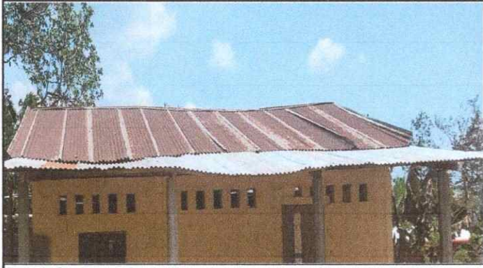
Foto 1: Se observa las laminas portantes de la cocina del modulo 1.